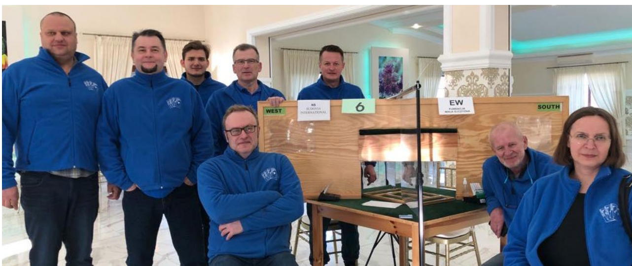
Drużyna Podlaskiej Akademii Brydża Fundacji Mała Ojczyzna

Łącznie na cztery rozegrane turnieje zajęli dwukrotnie pierwsze miejsce, a teraz dołożyli do nich jeszcze drugie. Samorząd Michałowa serdecznie pogratulował sukcesów lokalnemu zespołowi. (ps)